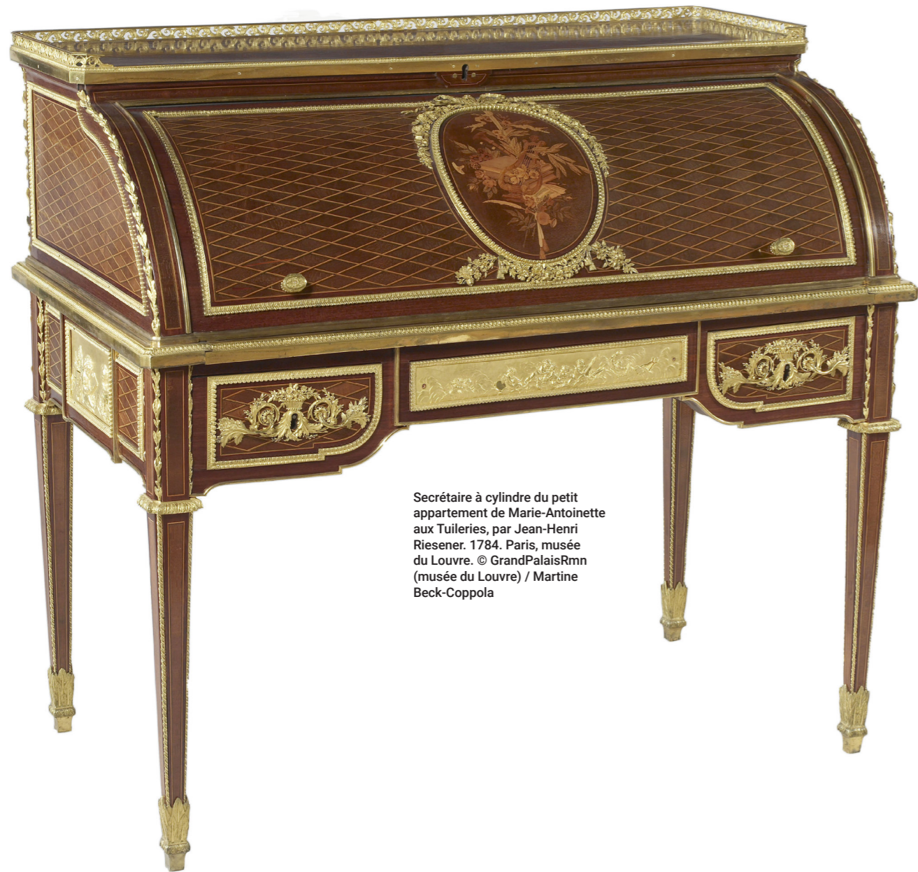
Secrétaire à cylindre du petit appartement de Marie-Antoinette aux Tuileries, par Jean-Henri Riesener. 1784. Paris, musée du Louvre.