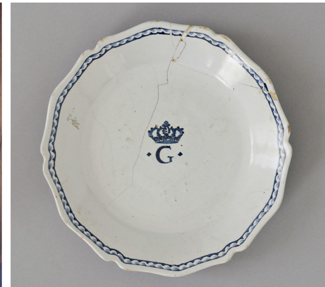
Marque au FG couronné, table à jeux. Château de Fontainebleau.