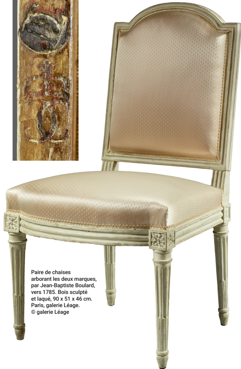
Paire de chaises arborant les deux marques, par Jean-Baptiste Boulard, vers 1785. Bois sculpté et laqué, 90 x 51 x 46 cm. Paris, galerie Léage.