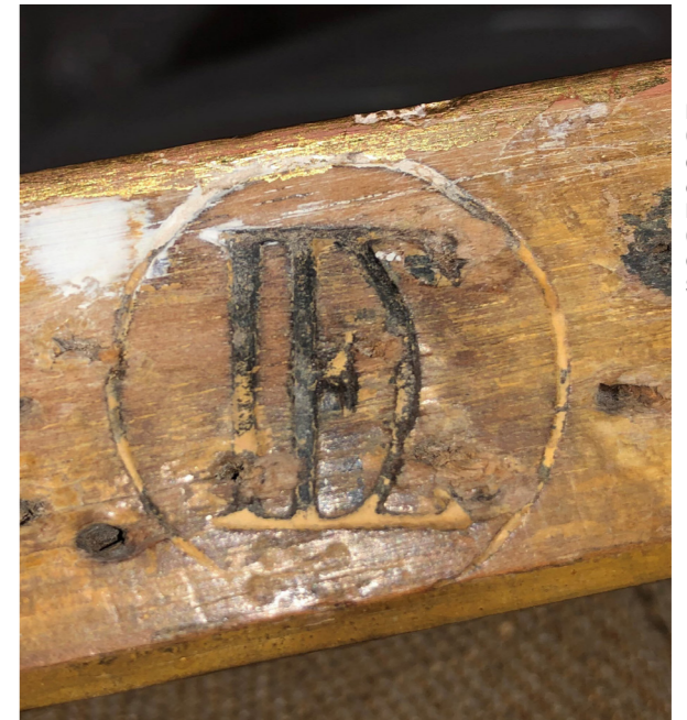
Marque du Garde-meuble du Directoire exécutif. Paris, Mobilier national, GME 13706/6.

En conclusion, rappelons que l'étude des marques employées sous l'Ancien Régime est délicate et nécessite beaucoup de prudence dans leur analyse. Seule la confrontation d'archives explicites à un corpus important de meubles conservés permet de cerner au mieux leur emploi, et d'en comprendre le sens réel. Dans cette optique, le Mobilier national prépare un catalogue des marques de meubles utilisées par le Garde-Meuble royal, impérial puis national entre le XVII e siècle et nos jours, à paraître en