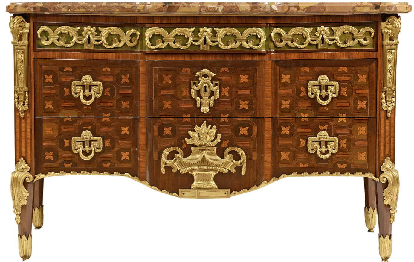
Commode par Antoine-François Mondon, vers 1775. Collection privée. Vente Paris Drouot, Castor-Hara, 21 novembre 2018, lot 120.

La marque fit aussi l'objet de déclinaisons géographiques. Sous Louis XVI, le linge du Garde-meuble de Versailles était parfois brodé d'un « GW » couronné 36 , celui de Compiègne d'un « GC » 37 et la batterie de cuisine en cuivre du Garde-meuble de Fontainebleau était marquée d'un « FG » couronné 38 . Cette dernière marque est exceptionnellement connue sur une table à jeux toujours conservée au château de Fontainebleau, que nous proposons ainsi d'identifier avec celle du Garde-meuble du château 39 . Certains meubles arborèrent aussi un P à l'encre (voir p. 73 en bas à droite), qui pourrait être « la marque de Paris » mentionnée par des documents d'archives 40 , et se rapporter ainsi au Garde-Meuble de la place Louis XV. Le mémoire de Courbin déjà cité mentionne ainsi la fabrication d'un fer avec une lettre P couronnée qui était appliquée seul 41 ou en complément du