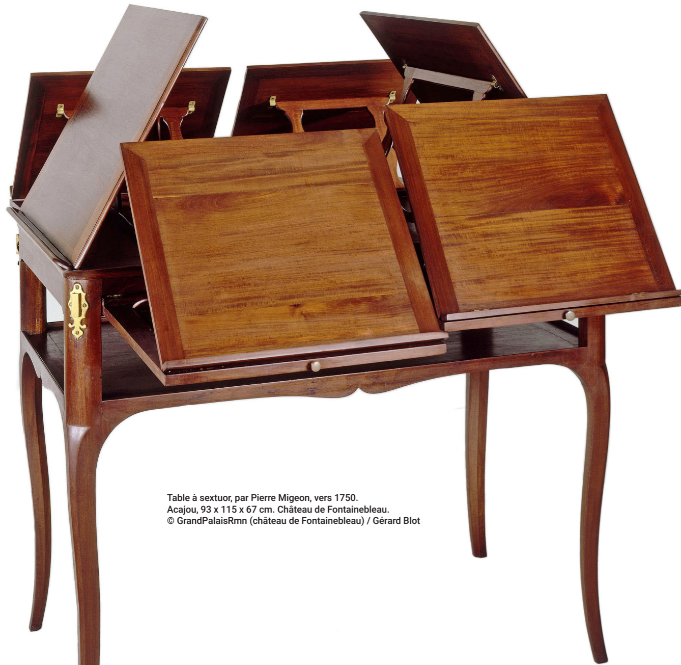
Table à sextuor, par Pierre Migeon, vers 1750. Acajou, 93 x 115 x 67 cm. Château de Fontainebleau.

pour ses marques les initiales ou les syllabes marquantes des châteaux, comme F pour Fontainebleau, LM pour La Muette ou BV pour Bellevue. Celle de Versailles est construite sur le même système que les deux G, en doublant l'initiale du château pour former un VV, communément désigné par erreur comme un W. De fait, les documents d'archives indiquent clairement que la lettre T fut désignée pour marquer les meubles des Tuileries : le serrurier Jacques-Antoine Courbin livra ainsi le 20 juillet 1788 une grande et une petite marque en acier avec la lettre T sous couronne royale suivie d'un « N° » pour marquer et numérotter les meubles et les bronzes 28 . Pourtant, c'est seulement à l'encre qu'est apposée la numérotation sur les meubles lors de l'inventaire de 1788 29 . La marque au fer ne semble ainsi pas avoir été utilisée, peut-être